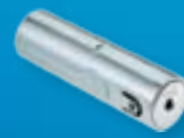
Tuby depozytowe do bezpiecznego przechowywania kluczy.