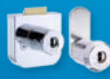
Zamki meblowe i zamki przemysłowe z funkcją CLIQ lub bez niej.