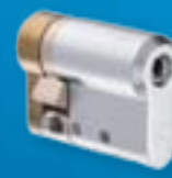
Cylindry do zamków do każdych drzwi.